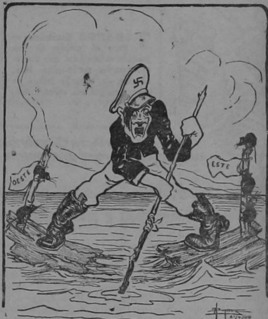
"Mein Got! No había yo previsto este jarrón..!"