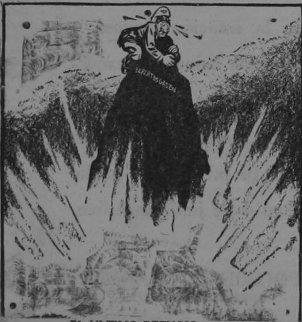
EL ULTIMO REFUGIO

Pídalo en todos los establecimientos - Cada barra dice "Fortuna" con todas sus letras